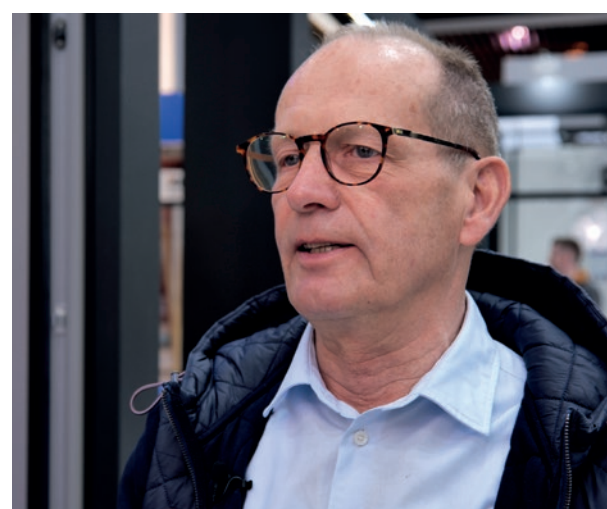
CHRISTIAN LUND CL GLAS & ALU A/S